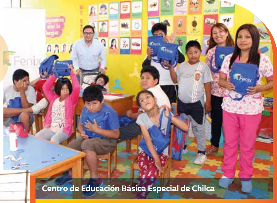
Centro de Educación Básica Especial de Chilca