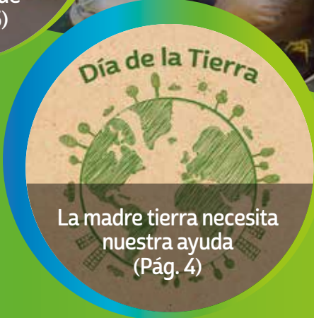
La madre tierra necesita nuestra ayuda (Pág. 4)