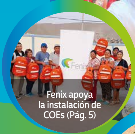
Fenix apoya la instalación de COEs (Pág. 5)