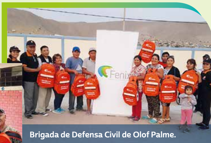
Brigada de Defensa Civil de Olof Palme.