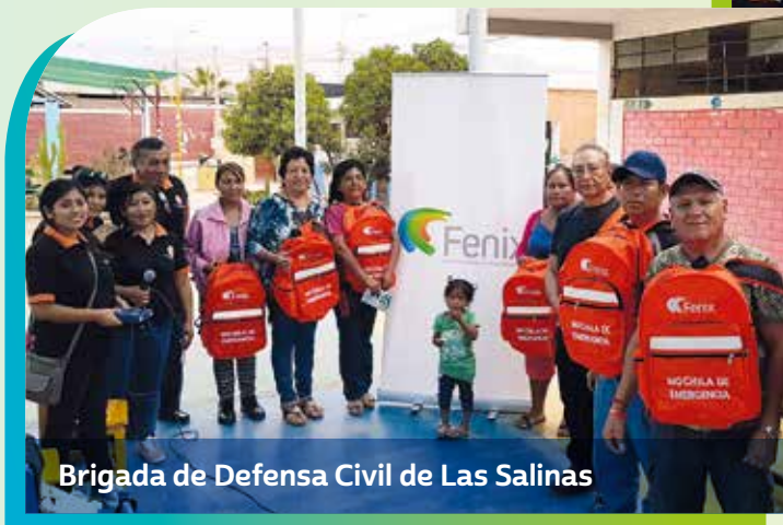
Brigada de Defensa Civil de Las Salinas